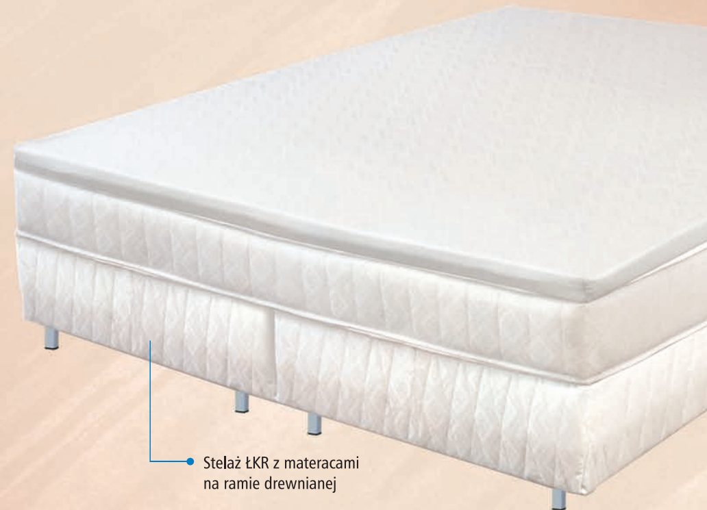
• Stelaż ŁKR z materacami na ramie drewnianej